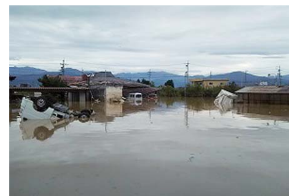
2019年10月、被災した赤沼の事務所。廃業を覚悟したが多くの人に助けられ、豊野で継続することに