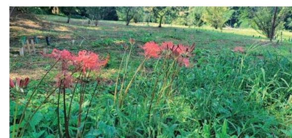
自然の命は自然に還す——アプリシエーションの「感謝の苑」にて樹下埋葬 ® が可能。骨箱は土に還るよう紙製